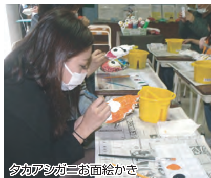
夕カアシガニお面絵かき