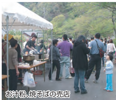
お汁粉、焼きそばの売店

嵐の予報。その為、時間を早めて開催となりました。予定していた時間での開催とはなりませんでしたが、多くの方々が遊びに来てくれました。特賞が高足ガニの輪投げや、焼きそば、焼き鳥、女性部提供のお汁粉等の出店があり、すべて完売となりました。開催時間は短かったものの、観光協会、商工会員、女性部をはじめ、多くの方々の協力