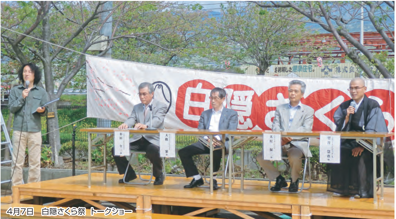
4月7日 白隠さくら祭 トークショー

発行者 沼津市商工会 会長 大村保二 〈本所・原支所〉沼津市原1200番地の1 TEL(055)966-1331 FAX (055)967-4925 〈戸田支所〉沼津市戸田1028番地の5 TEL(0558)94-2224 FAX (0558)94-4029 編集 沼津市商工会広報委員会