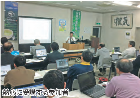
熱心に受講する参加者